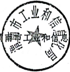
渭南市工业和信息化局