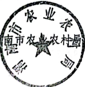
渭南市农业农村局