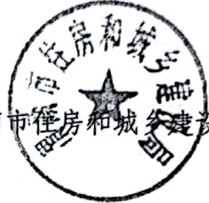
渭南市住房和城乡建设局