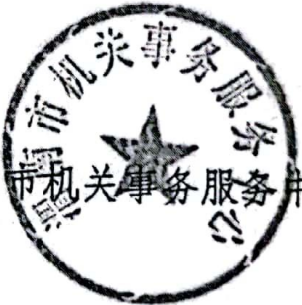
渭南市机关事务服务中心