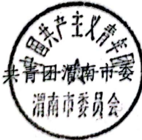
共青团渭南市委 渭南市委员会