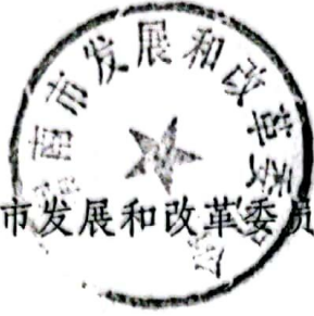
渭南市发展和改革委员会