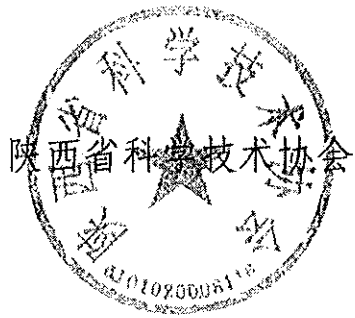
陕西省科学技术协会