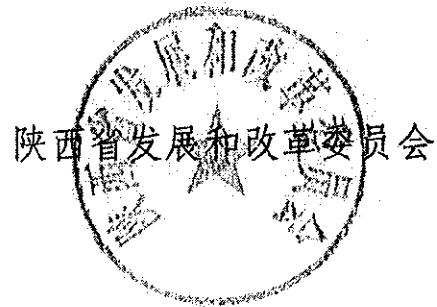
陕西省发展和改革委员会