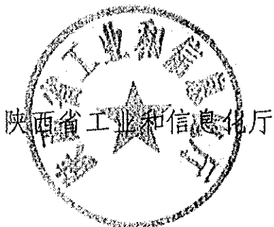
陕西省工业和信息化厅