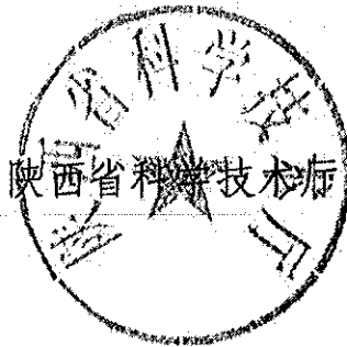
陕西省科学技术厅